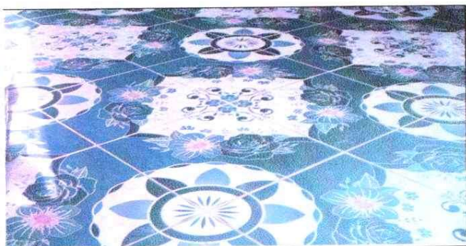
NOTA: Mejoramiento de piso Ceramico para aulas y cocina