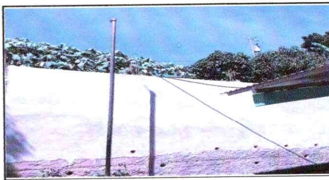
NOTA: Mejoramiento de Muro Perimetral

Observación: Si es necesario se pueden agregar Hojas adicionales y actualizar el número de hojas.