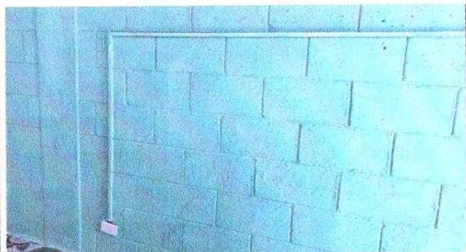
NOTA: mejoramiento de Energía Elctrica