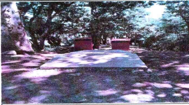
NOTA: Mejoramiento de Sanitarios