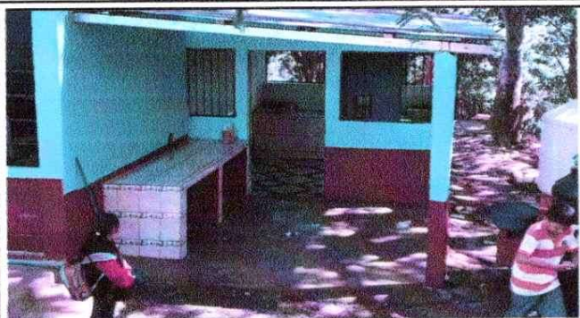
NOTA: Mejoramiento de Cocina,