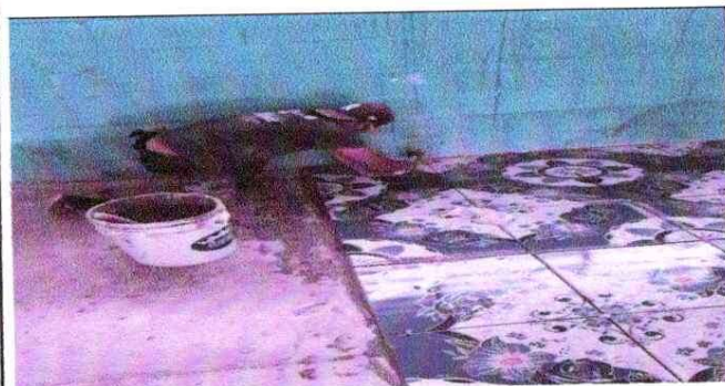
NOTA: Mejoramiento de piso Ceramico para Aulas