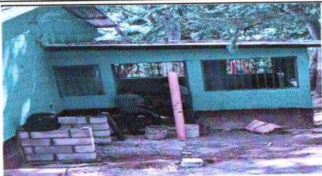
NOTA: Mejoramiento de Cocina,