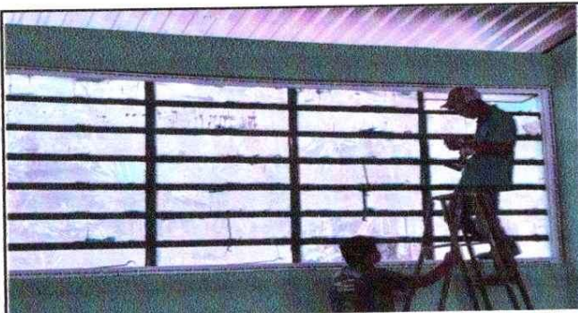
NOTA: Sustitución de Ventana de PVC