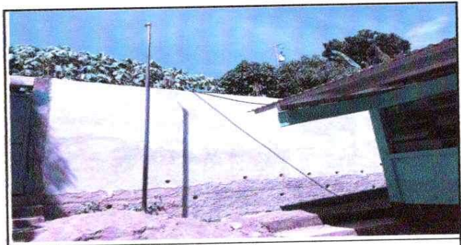
NOTA: Mejoramiento del Muro Perimetral

Observación: Si es necesario se pueden agregar hojas adicionales y actualizar el número de hojas.