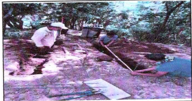
NOTA: Mejoramiento del Servicios Sanitarios