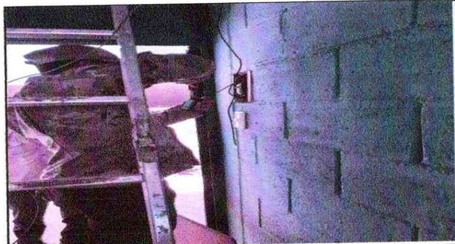
NOTA: Mejoramiento del Sistema Electrico