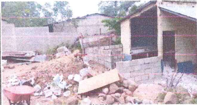
AMPLIACIÓN DE COCINA