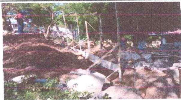
MANTENIMIENTO DE MURO DE CONTENCIÓN CON CONCRETO CICLÓPEO