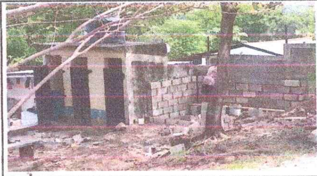
AMPLIACIÓN DE BAÑOS