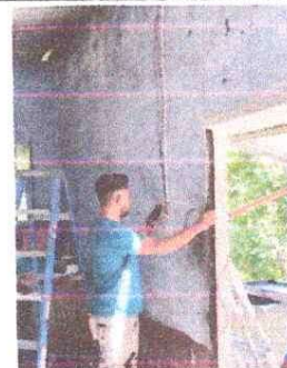
INSTALACION DE ENERGIA ELÉCTRICA

Observación: Si es necesario se pueden agregar hojas adicionales y actualizar el número de hojas.