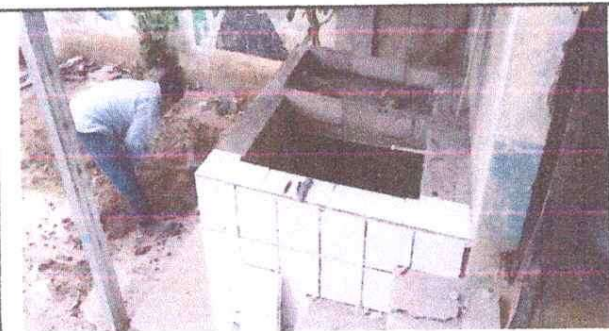
MANTENIMIENTO DE PILA