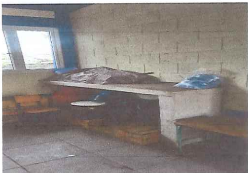
COCINA: Se necesita azulejo y muebles de cocina