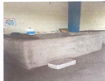
PILA: Se necesita azulejo para pila