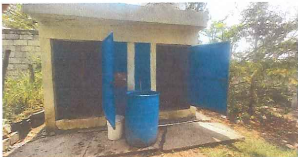
SISTEMA ELÉCTRICO: Se necesita instalación de energía eléctrica en los servicios sanitarios.