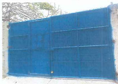
PORTON : Se necesita mantenimiento de portón de metal.

Observación: Si es necesario se pueden agregar hojas adicionales y actualizar el número de hojas.