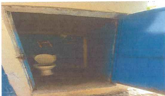
SERVICIOS SANITARIOS Y SUS ACCESORIOS: Se necesita repello, azulejo, piso y lavamanos.