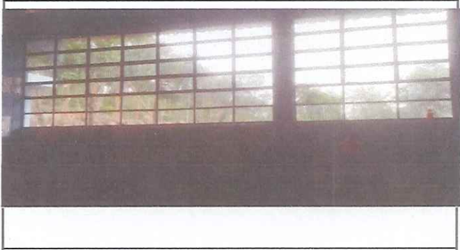
VENTANAS NECESITA BALCONES