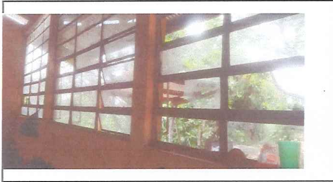
VENTANAS QUEBRADAS EN MALAS CONDICIONES