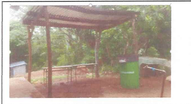
COCINA EN MAL ESTADO, SE NECESITA REMOZAMIENTO