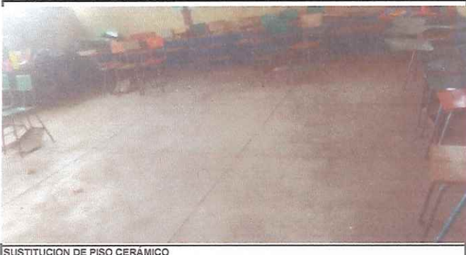
SUSTITUCION DE PISO CERÁMICO