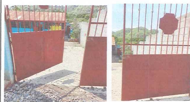
Portón: Se necesita el remozamiento del porton de la entrada principal a la escuela