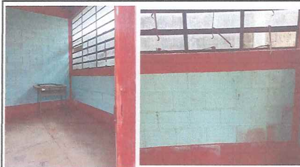
Cocina: se necesita mantenimiento en repello, azulejo, piso y mueble de cocina, pila, estufa de leña y reparacion de sistema electrico.