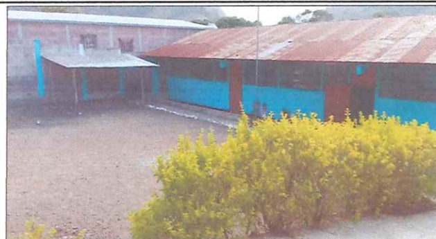
Aulas y direcccion: sustitucion de lamina por lamina troquelada, remosamiento de estructura metalica, reparacion de sistema electrico, y sustitucion de canas para agua pluvial.