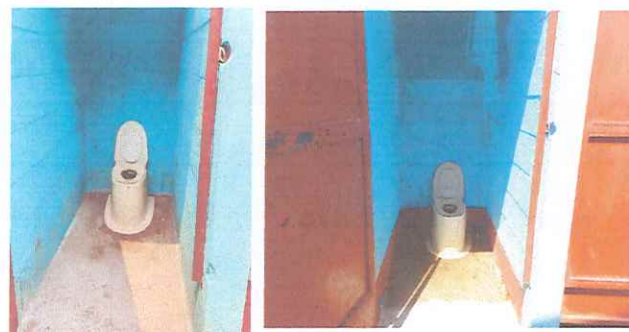
Baños : Sustitucion de letrinas de fibra , remozamiento de puertas en servicio sanitario.