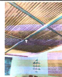
Foto 5: Área de aulas se pintara la estructura metálica y lamina de color gris anticorrosivo.