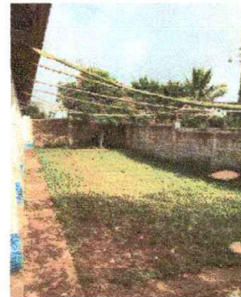
Foto 4: En Patio se colocara una galera de estructura metálica y lamina troquelada calibre 26.