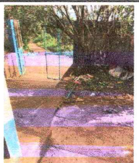
Foto 6: Área entrada se hará un muro protector con baranda metálica.

Observación: Si es necesario se pueden agregar hojas adicionales y actualizar el número de hojas.