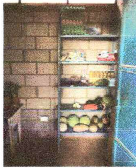
Foto 1: Cocina se hará un remozamiento de mesa de concreto, se hará el poyotón con plancha de cocina + chimenea, se colocara azulejo en estufa y paredes, y el remozamiento de puertas.