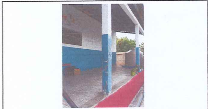
INSTALACIÓN DE BARANDA POR SEGURIDAD DE LOS NIÑOS