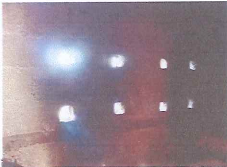
ABERTURA DE VENTANA EN COCINA Y COLOCACION DE BALCON