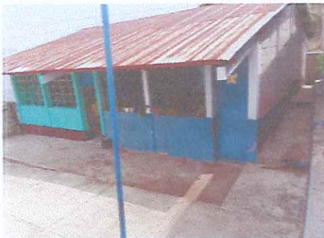
PINTURA EN FACHADAS DE AULAS, BAÑOS Y COCINA