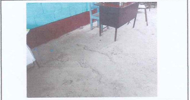
INSTALACIÓN DE PISO CERAMICO EN AULAS