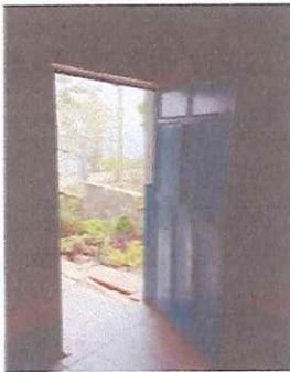
BARANDA PARA SEGURIDAD DE EQUIPO DE COMPUTO