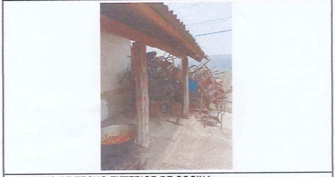
REFUERZO DE TECHO EXTERIOR DE COCINA

Observación: Si es necesario se pueden agregar hojas adicionales y actualizar el número de hojas.