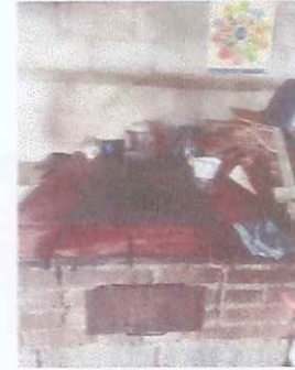
CAMBIO DE ESTUFA DE LENA CON CHIMENEA

Observación: Si es necesario se pueden agregar hojas adicionales y actualizaciones de hojas.