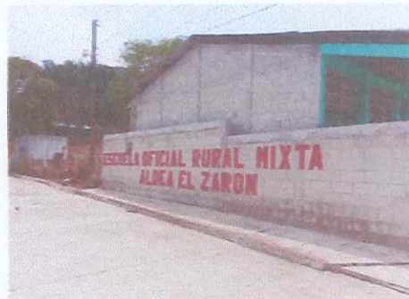
PINTURA EN EXTERIOR DE ESCUELA