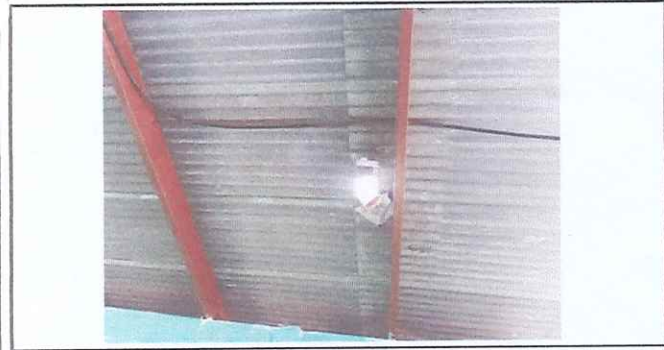
REPARACIONES DE LAMINA EN AULAS