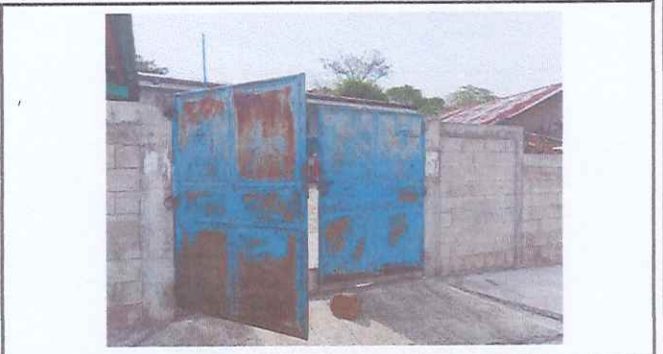
REPARACIÓN DE PORTÓN DE INGRESO