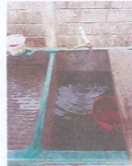
INSTALACION DE AZULEJO EN PILA