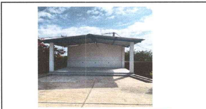
REMOSAMIENTO DE ESCENARIO POSTERIOR