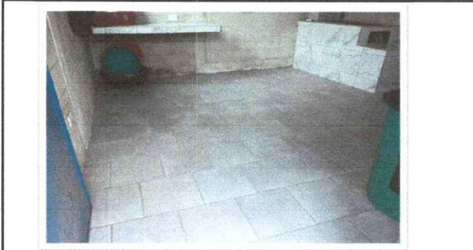
REMOSAMIENTO DE PISO CERAMICO POSTERIOR