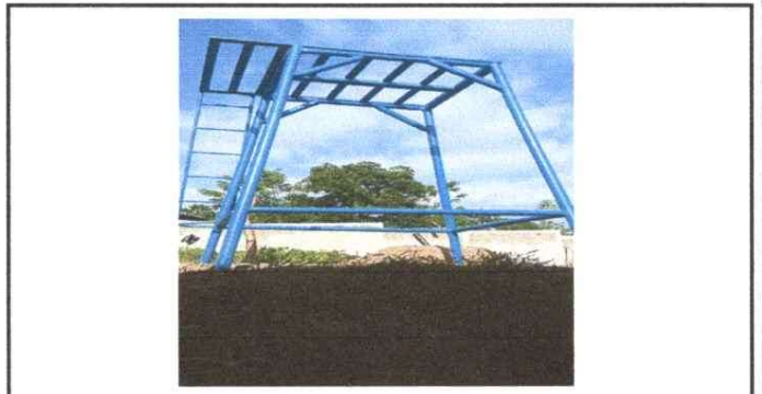
BASE DE TINACO POSTERIOR