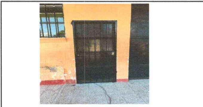
REMOSAMIENTO DE PUERTA BalcÓN POSTERIOR