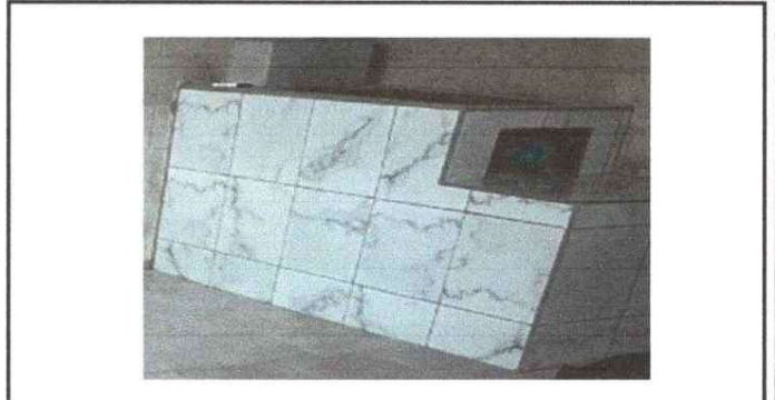
REMOSAMIENTO DE PLANCHA POSTERIOR