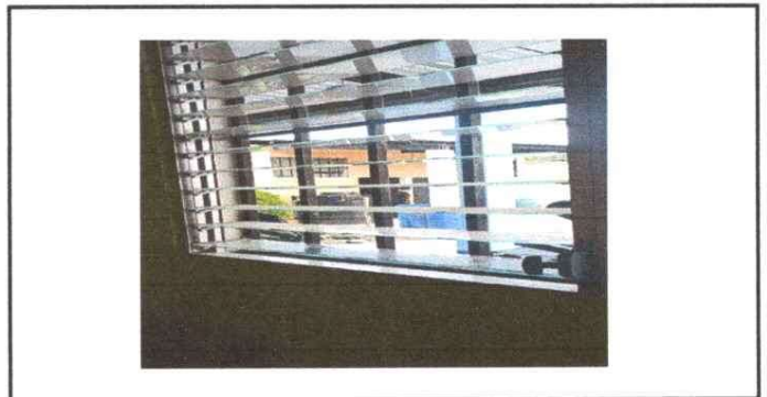
REMOSAMIENTO DE TECHO DE VIDRIO DE VENTANAS POSTERIOR

Observación: Si es necesario se pueden agregar hojas adicionales y actualizar el número de hojas.