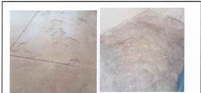
se necesita instalación de piso en torta en mal estado.