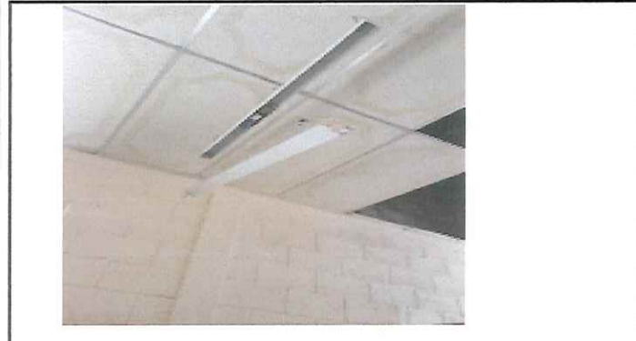
Se necesita reparación de sistema eléctrico.