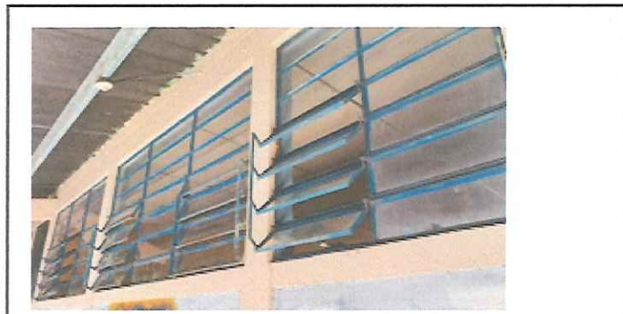
instalación de ventanas en pvc