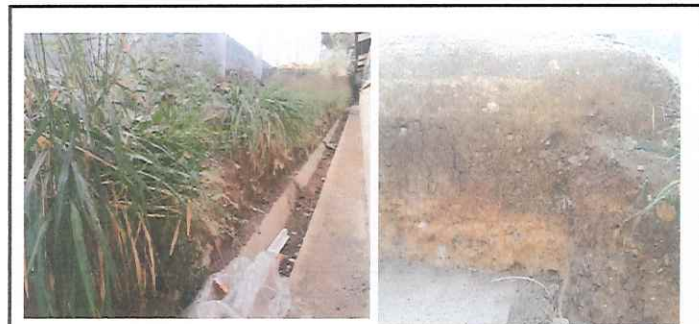
se necesita reparación en muro de contención.