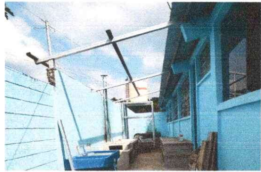
SUSTITUCIÓN CUBIERTA DE LÁMINA TROQUELADA CALIBRE 26