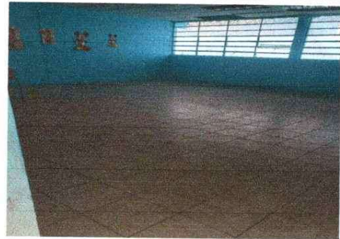
INSTALACION DE PISO EN AULA 4