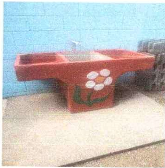
SUSTITUCION DE PILA CON CONEXIÓN DE AGUA POTABLE Y DRENAJE

Observación: Si es necesario se pueden agregar hojas adicionales y actualizar el número de hojas.