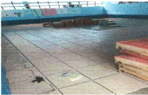
INSTALACIÓN DE PISO EN UN AULA 1