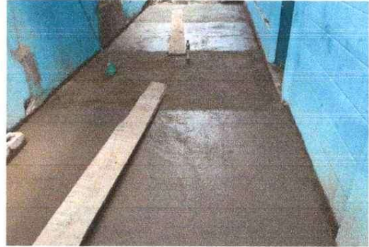
MEJORAMIENTO CONTRAPISO EN COCINA