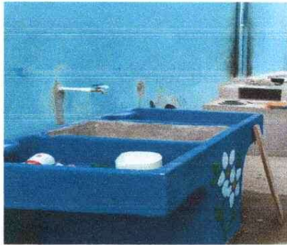
MEJORAMIENTO EN PILA DE COCINA CON CONEXIÓN DE AGUA POTABLE