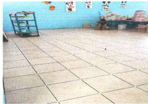
INSTALACIÓN DE PISO AULA 2

Observación: Si es necesario se pueden agregar hojas adicionales y actualizar el número de hojas.