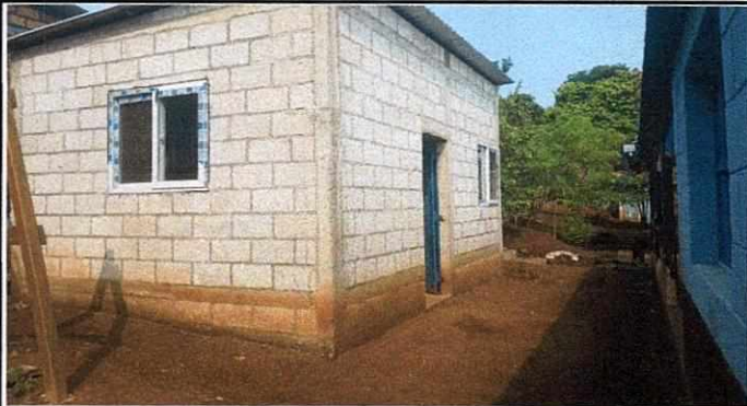
Foto 1: Remodelación de cocina antes de realizar el repello, ya se instalaron ventanas.