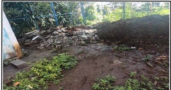
Foto 2: preparando el área para la construcción de una mesa en la parte externa del establecimiento.