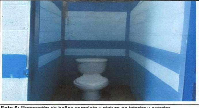
Foto 6: Reparación de baños completa y pintura en interior y exterior.

Observación: Si es necesario se pueden agregar hojas adicionales y actualizar el número de hojas.