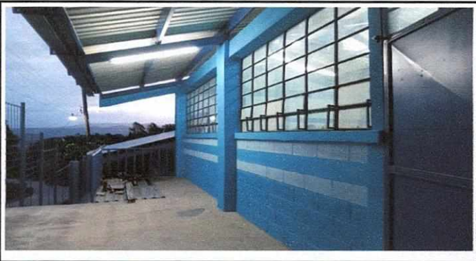
Foto 4: Restauración energía eléctrica y trabajos de pintura en fachada frontal de aulas.