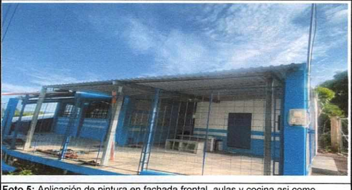
Foto 5: Aplicación de pintura en fachada frontal, aulas y cocina así como techado completo en área de cocina, baños y patio.