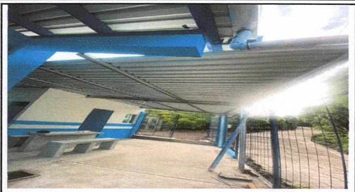
Foto 1: Patio debidamente pavimentado, techado, con realización de mesa con azulejo para el servicio de los niños y niñas.