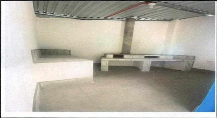
Foto 3: Muebles de cocina de concreto con azulejo y estufa rural con comal y su chimenea.