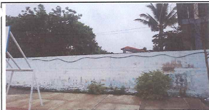
Foto 5: Se colocara dos hiladas de block para reforzar la seguridad del muro perimetral.