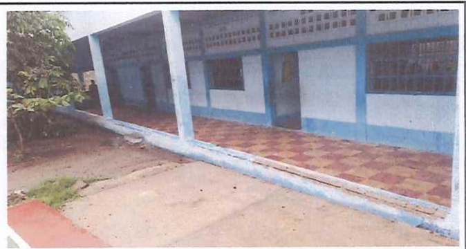
Foto 6: se construirá un modulo de gradas y se tallara la solera final de pasamanos en aulas.

Observación: Si es necesario se pueden agregar hojas adicionales y actualizar el número de hojas.