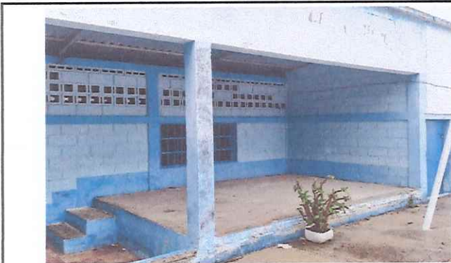
Foto 3: Se construirá área de bodega con paredes de block y se colocara puerta y ventana.