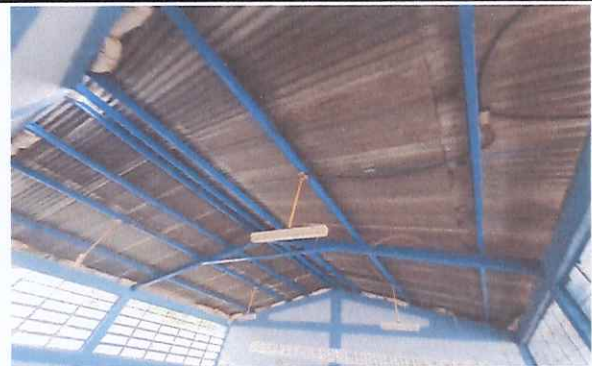
Foto 4: En aulas se cambiara todo recubrimiento de techo con lamina troquelada calibre 26.