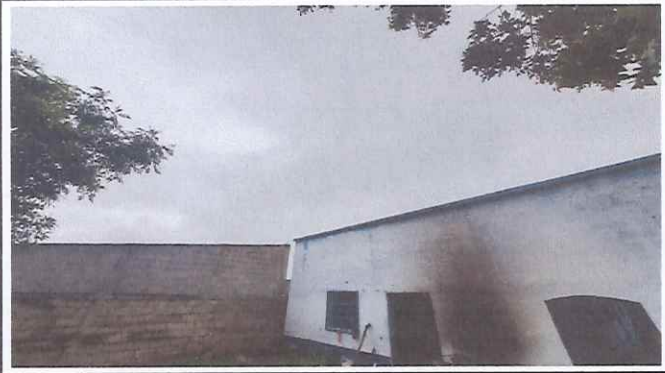
Foto 2: Área de cocina se pondrá techo con estructura metálica y se colocara drenajes para conducir el agua pluvial.