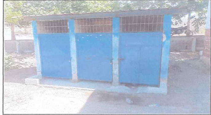
se necesita cambiar 3 inodoros, mejoramiento de puertas, cambio de lamina y pintura.