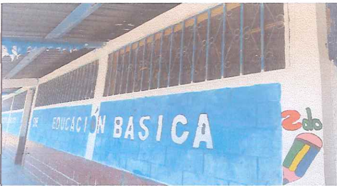
se necetita pintar los balcones, puertas, porton y todas las aulas.