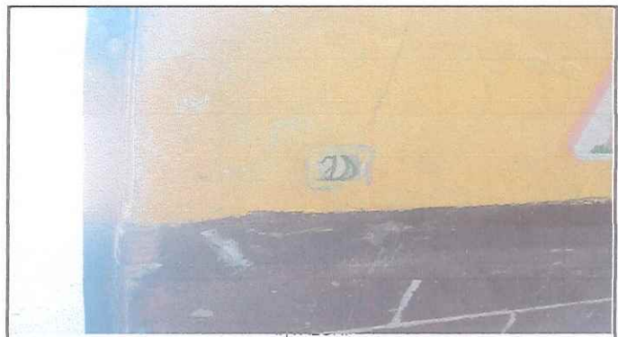
Se necesita instalación electrica en todas las aulas.