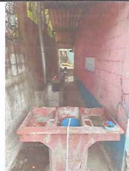
Foto 6: Demolición de cocina deteriorada, fundición de contrapiso.

Observación: Si es necesario se pueden agregar hojas adicionales y actualizar el número de hojas.