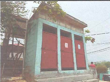
Foto 5: Pintura general, mantenimiento de puertas, mejoramiento instalación de tinaco y accesorios.