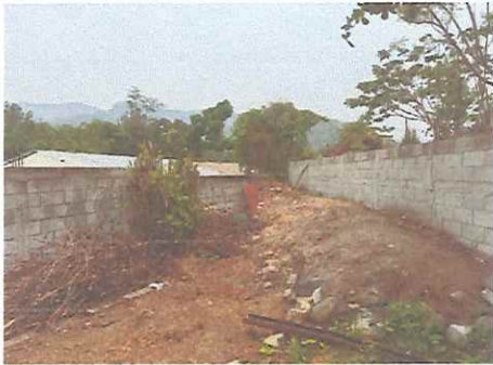
Foto 7: Continuar levantado de circulación, instalación de techo y estructura metálica, fundición de contrapiso, construcción estufa rural con chimenea, instalación de pila, instalación eléctrica y cerramiento con malla ciclón.