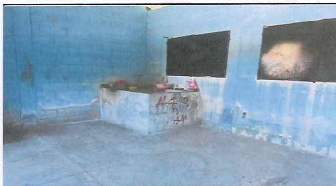
reparacion de pila y repello