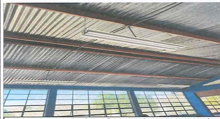
cambio de alumbrado electrico por focos normal porque estan quemados