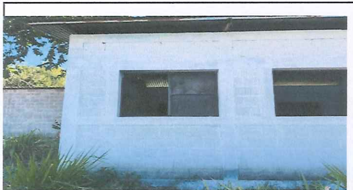
pintura de pared, puertas y ventanas de la cocina.