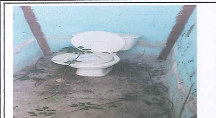
se necesita sustitucion de baños e intalacion de drenaje ya que esta tapado.