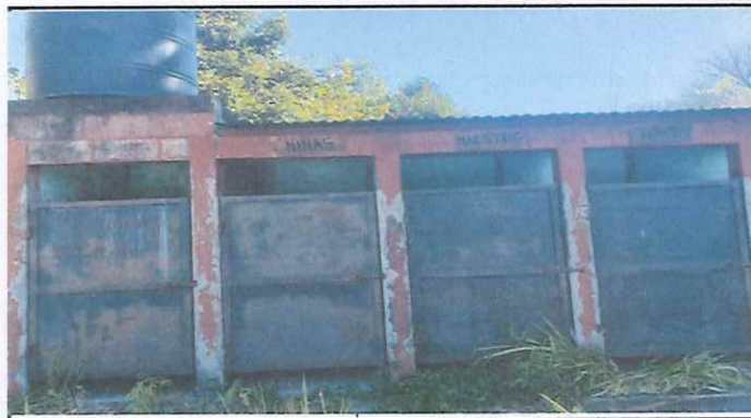
Instalacion de agua para baños, pintura y reposicion de puertas.