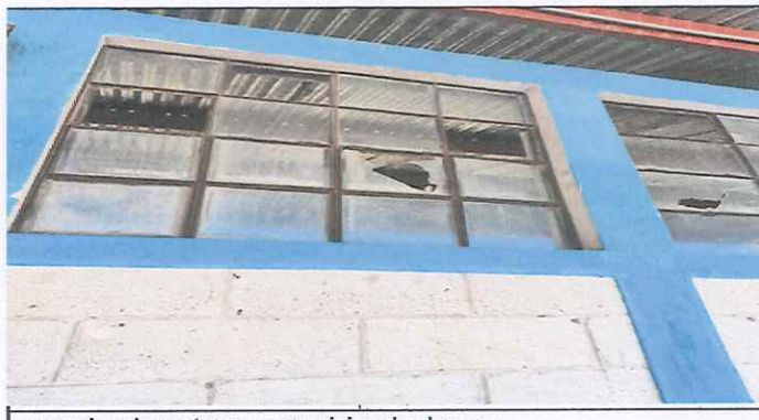
reparacion de ventanas y reposicion de algunas

Observación: Si es necesario se pueden agregar hojas adicionales y actualizar el número de hojas.