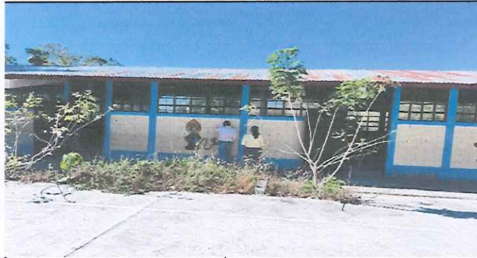
pintura de escuela