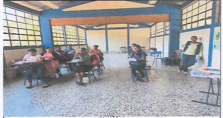
renovacion de persiana para separacion de aula.