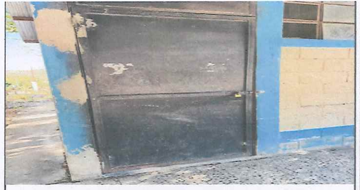
colocacion de chapa a puertas.