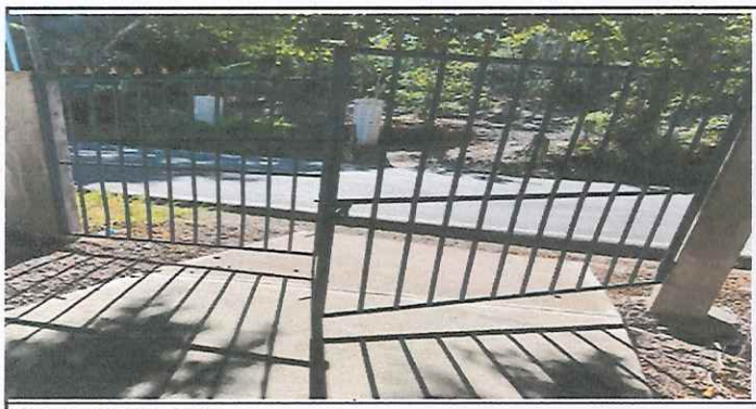
reparacion de porton.