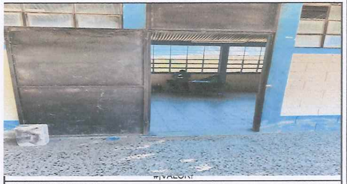
reparacion de puertas.

Observación: Si es necesario se pueden agregar hojas adicionales y actualizar el número de hojas.