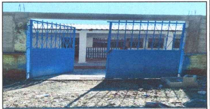
FOTO 6: PUERTAS Y BALCONES DETERIORADOS, SE LES HIZO MANTENIMIENTO, APLICACIÓN DE PINTURA A SEGUNDA MANO Y CAMBIO RESPECTIVOS DE CHAPAS

Observación: Si es necesario se pueden agregar hojas adicionales y actualizar el número de hojas.