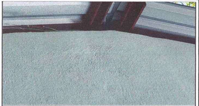
FOTO 2: ESTRUCTURA DE SOPORTE DE MADERA EN MAL ESTADO, SE SUSTITUYÓ POR ESTRUCTURA DE METAL