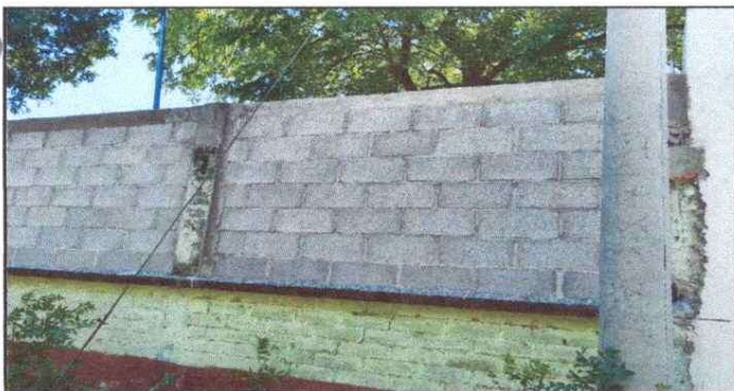
FOTO 5: MURO PERIMETRAL EN MAL ESTADO, SE SUSTITUYÓ LA MALLA GALVANIZADA Y TAMBIEN SE HIZO REMOZAMIENTO Y TALLADO DE COLUMNAS