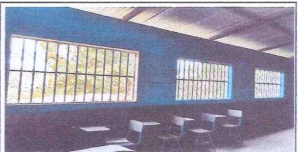
Foto 6: VENTANAS Se cambiaran por ventanas pvc para que la lluvia no entre al aula

Observación: Si es necesario se pueden agregar hojas adicionales y quitar el número de hojas.