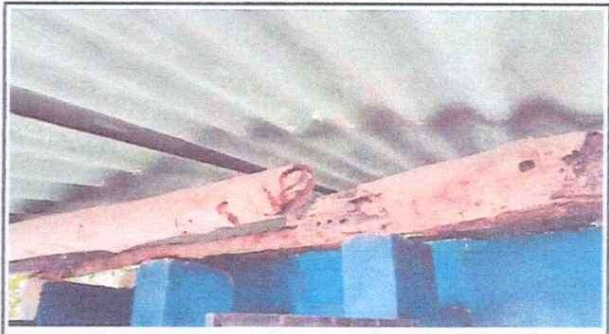
Foto 2: TECHO Se cambiara la madera rustica por estructura metalica en los baños