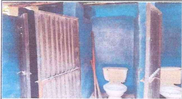
Foto 1: PUERTA: Se cambiarán las puertas de los baños por estar en mal estado