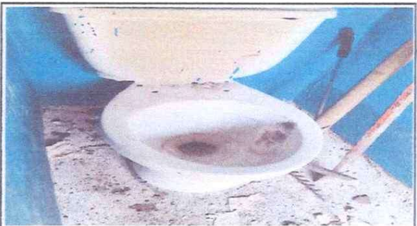
Foto 4: SANITARIOS Se cambiaran los inodoros por estar en mal estado