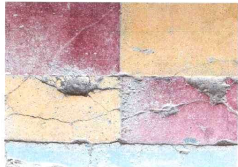
Foto 2: Piso del Centro Educativo deteriorado. Se sustituirá en su totalidad.