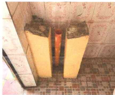
Foto 4: Lavamanos de Servicios Sanitarios en total deterioro. Sustitución total