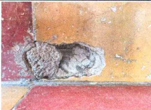
Foto 3: Mal estado de piso en Servicios Sanitarios. Se sustituirá en su totalidad.