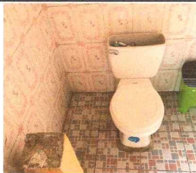
Foto 5: Servicios Sanitarios fuera de servicio por mal estado. Sustitución total.