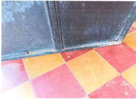
Foto 1: Puertas de salones de clase en mal estado, se sustituirán.