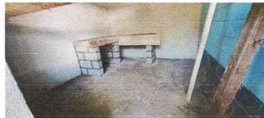
21. Reparación de Repello

Observación: Si es necesario se pueden agregar hojas adicionales y actualizar el número de hojas.