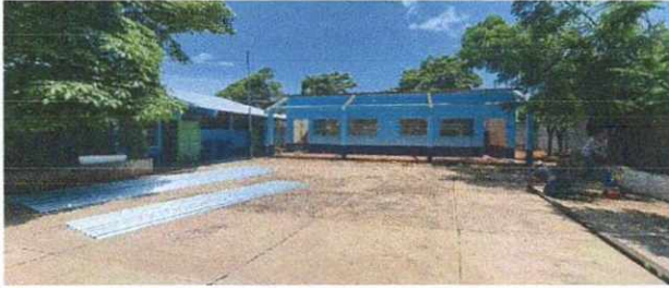
1. Cubierta de lámina.