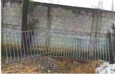
11. Mantenimiento a barandas.