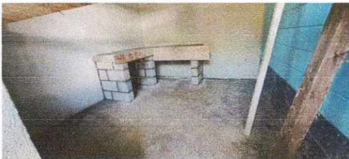
20. Sustitución de área de cocina.