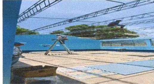
2. Estructura de Techo.