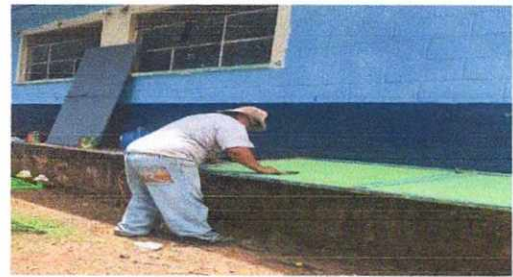
4. Puerta. Realizando reparación y mantenimiento de puertas.