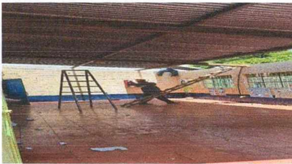
2. Estructura de Techo.