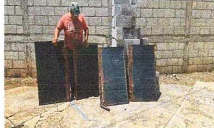
12. Mantenimiento de portón