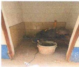
6. Piso. Foto frontal trabajando el área de los sanitarios.