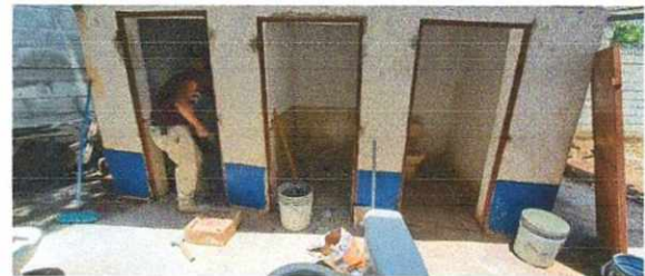
10. Servicios de Sanitarios y sus accesorios. Foto frontal trabajando el área de sanitarios.

Observación: Si es necesario se pueden agregar hojas adicionales y actualizar el número de hojas.