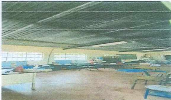
2. Estructura de techo.