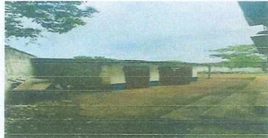
1. Cubierta de lámina