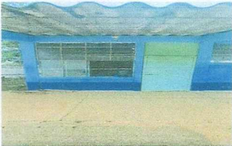
20. Sustitución de cocina.