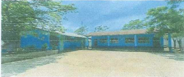
1. Cubierta de lámina.