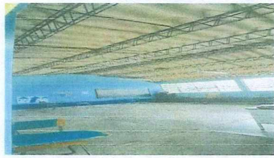
2. Estructura de techo