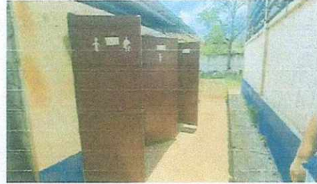
10. Servicio de sanitarios.