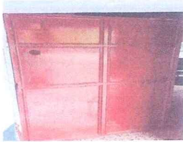
Foto1: PUERTA: Reparación de Puertas