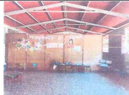
Foto 10: Reparación de división de salón de usos múltiples ( cancel)

Observación: Si es necesario se pueden agregar hojas adicionales y actualizar el número de hojas.