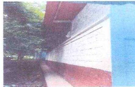
Foto 4: Pintura General a aulas, servicios, sanitarios , cocina ( dentro y fuera )