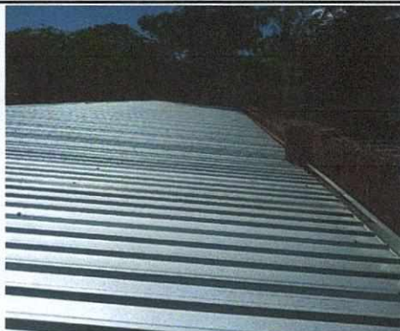
Foto 1. Techo. Cambio de techo en las aulas