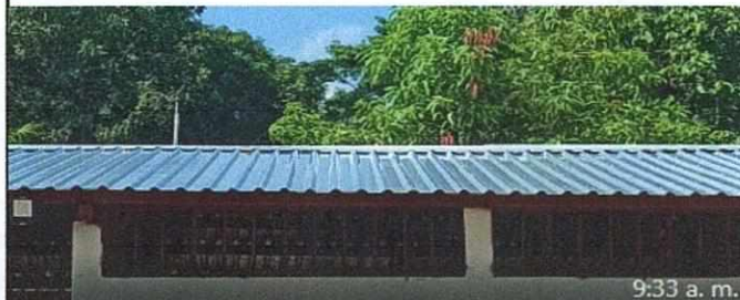
Foto 2 reparacion de techo en las aulas