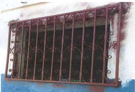
Foto 3 reparacion de ventanas