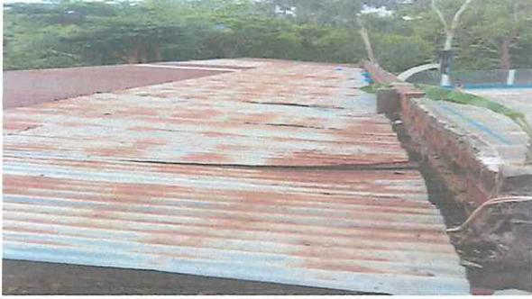
foto 1. Techo. Cambio de techo en las aulas