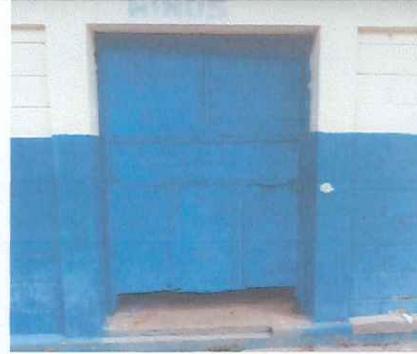
foto 2 reparacion de puertas y chapas