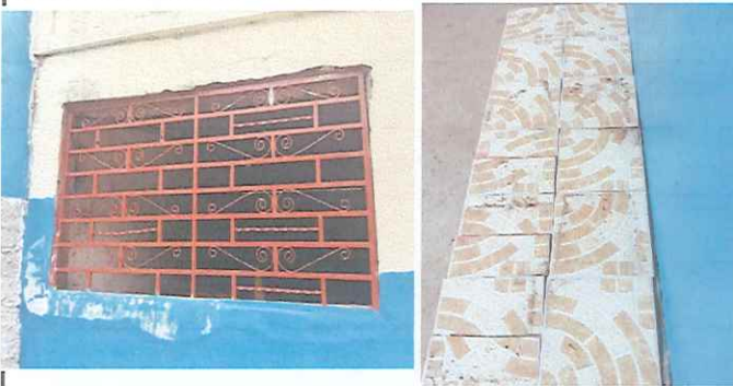
foto 3 reparacion de ventanas y reparacion de piso