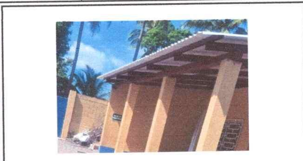
Foto1: Lámina en mal estado, se sustituirá