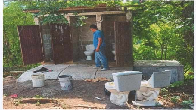
Foto 2: Reparación de sanitarios en mal estado, mantenimiento en techo y puertas.