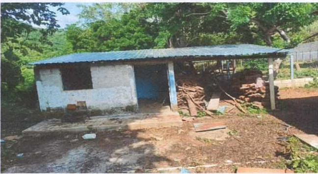
Foto 3: Reparación del techo en mal estado, colocación de puerta y ventana en la Cocina.