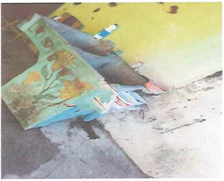
PILA A MEJORAR