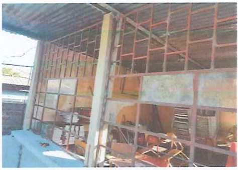
BODEGA A MEJORAR