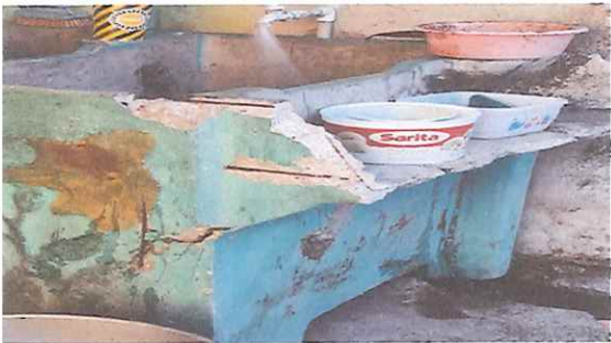
Foto No. 3 Pila en mal estado, corren peligro los niños al momento de hacer uso de ellas se comprará una nueva