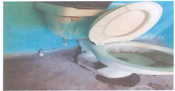
Foto No. 4 Sanitarios en mal estado, se comprarán nuevo, para brindar mejor higiene a los alumnos