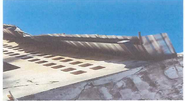
Foto No. 2 Techo de un aula, en mal estado