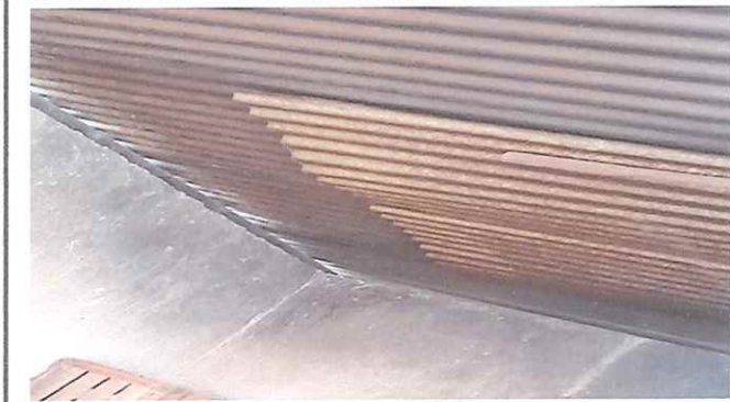
Foto No. 1 techo de la cocina, se encuentra en mal estado, se colocará lámina nueva