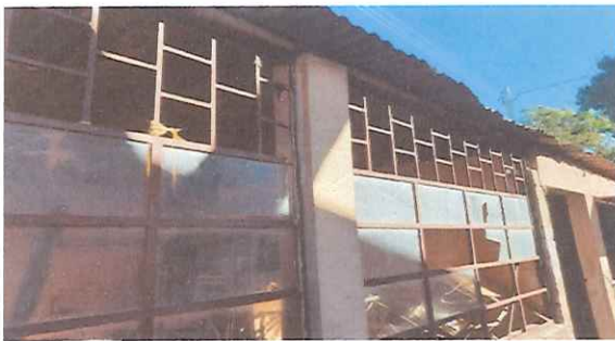
Foto No. 5 Ventanales de vidrio en mal estado, Se les colocarán vidrio para mayor seguridad de la bodega