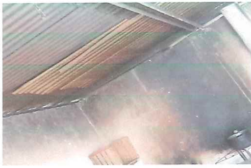
TECHO A MEJORAR