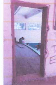
Foto 2 PUERTAS: se uniran ambos espacios y se colocara una puerta mas amplia