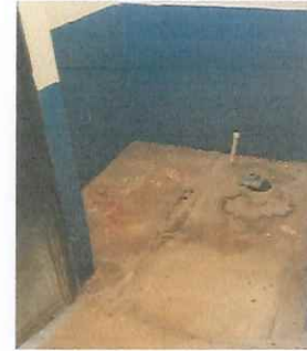
Foto 10: Reparación de piso, instalación de sanitario, puerta y azulejos.