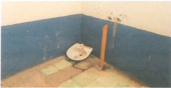
Foto 9: Reparación y sustitución de azulejos, lavamanos y piso en los 3 sanitarios, de hombres y mujeres