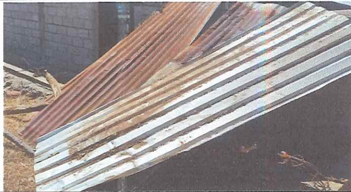
Foto 1: Cocina improvisada, derrumbada por el viento, madera podrida