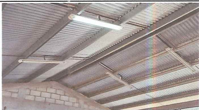
Foto 3: Luces en mal estado, el tipo de lámparas no resiste los cambios de voltage