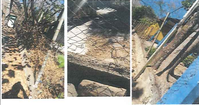
Foto 1: Muro perimetral, se encuentra en malas condiciones, dejando expuesta la seguridad de los niños.