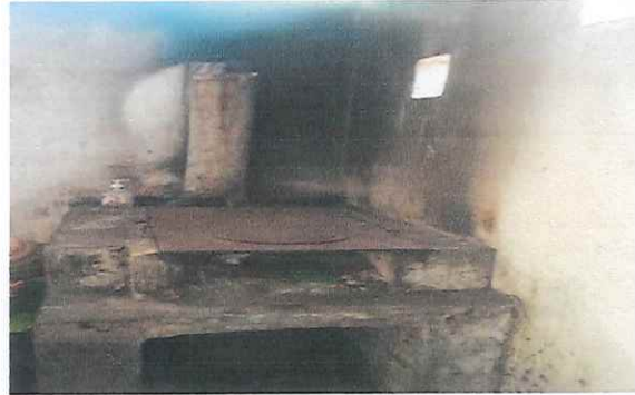
Foto 4: Area de cocina en mal estado, no funciona plancha, chimenea, necesita sustitucion para garantizar una mejor coccion de alimentos