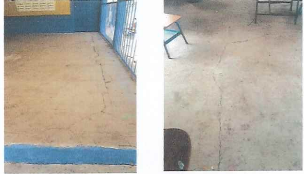
Foto 2: Area de corredores y aulas sin piso, y el concreto ya se encuentra con grietas.