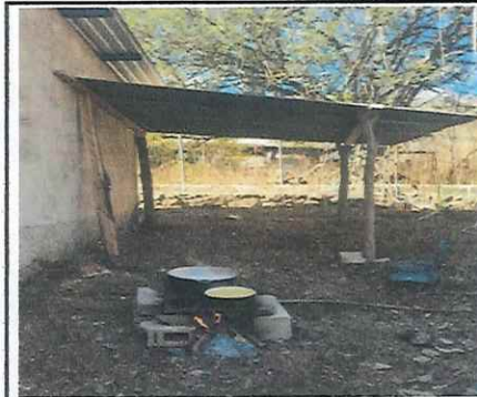
Foto 6: galera en mal estado, siendo un riesgo para estudiantes y docentes de la escuela.lamina picada y bases podridas.

Observación: Si es necesario se pueden agregar hojas adicionales y actualizar el número de hojas.