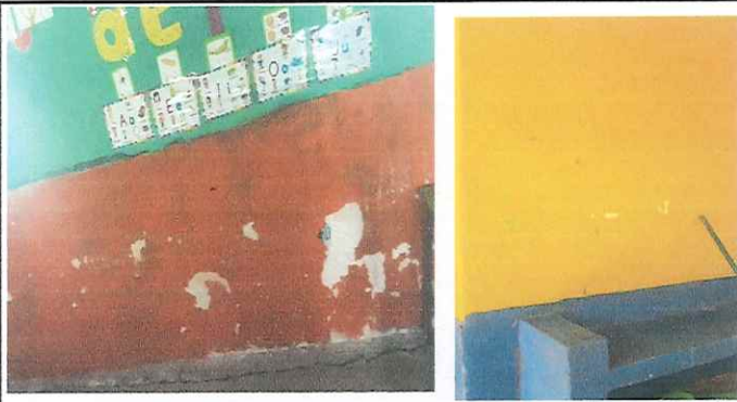
Foto 3: Pintura de interiores y exteriores se encuentran deteriorandose.