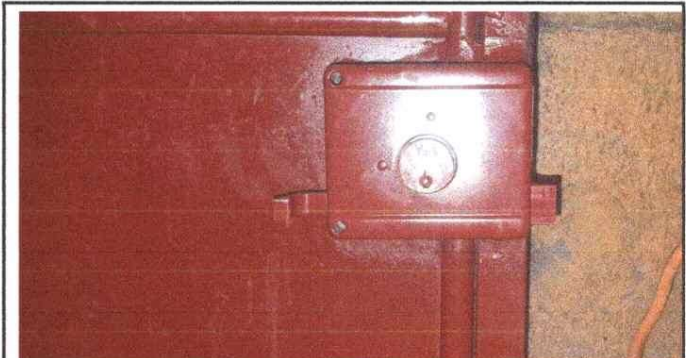
Foto 4: Mantenimiento de puertas, Cambio de Chapas, pintura, sujeciones.