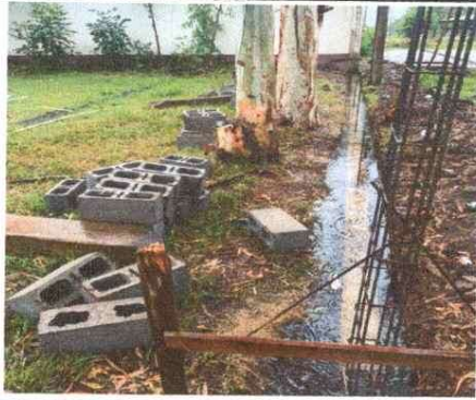
Foto1: Reparación de Muro Perimetral