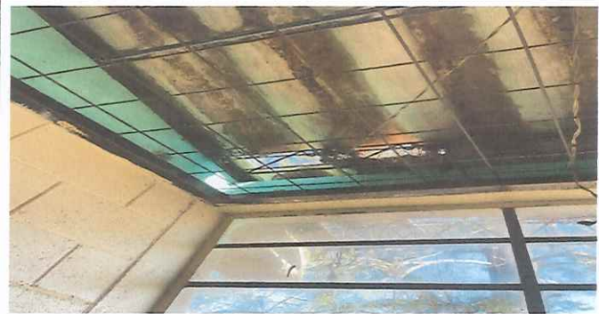
Foto 4: Techo de aula 02 estructura y duralita en mal estado para Sustitución de techo de metal a metal.