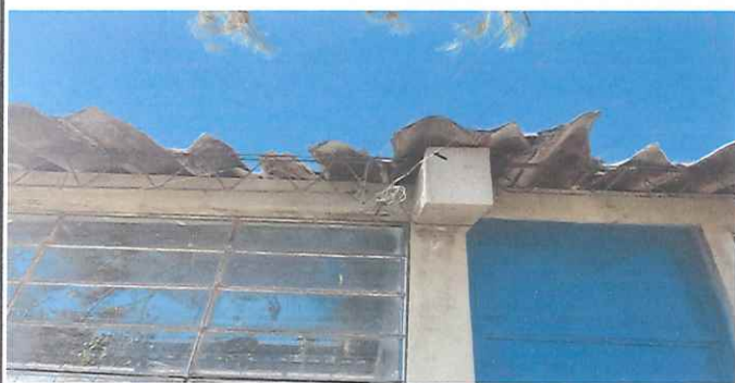
Foto 3: Techo de aula 02 estructura y duralita en mal estado para Sustitución de techo de metal a metal.