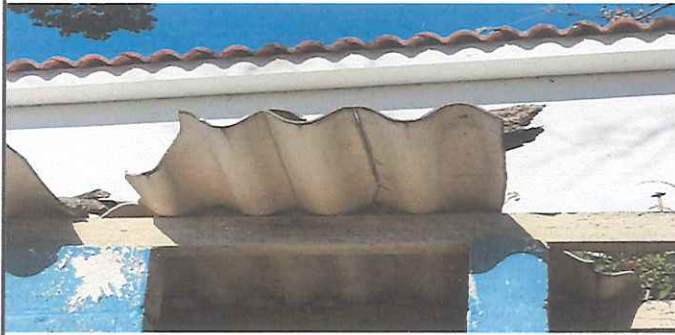
Foto 1: Techo de aula 1 deteriorado para Sustitución de techo de Madera a metal.