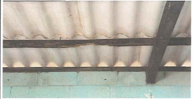
Foto 2: Techo de aula 1 madera y duralita en mal estado para Sustitución de techo de Madera a metal.