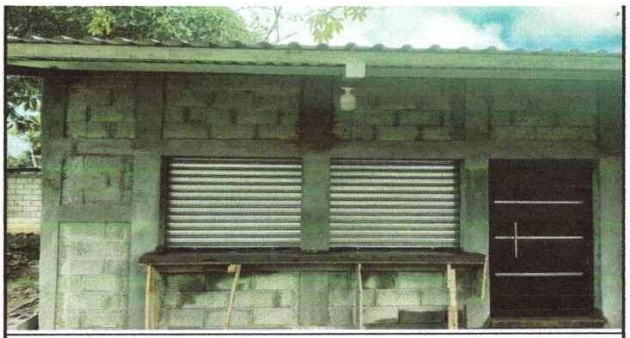
Foto 6: Instalación de dos cortinas metálicas para ventana y una puerta principal para la reparación de la cocina

Observación: Si es necesario se pueden agregar hojas adicionales y actualizar el número de hojas.