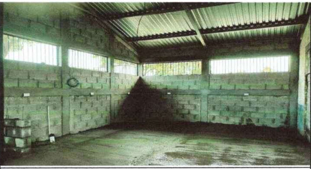
Foto 5: Sustitución de unidad de luz y sustitución de piso de cemento de concreto para la reparación de la cocina