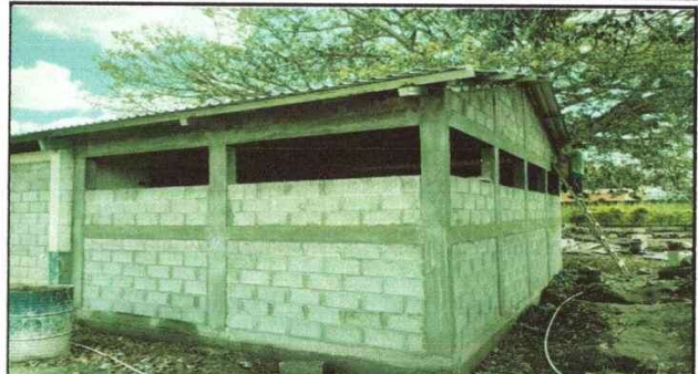
Foto 2: Instalación de techo de lámina aluzinc calibre 26 para la reparación de la cocina