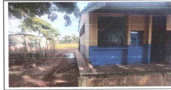
Foto 6: Parte frontal de cocina donde se realizará la ampliación y remodelación

Observación: Si es necesario se pueden agregar hojas adicionales y actualizar el número de hojas.