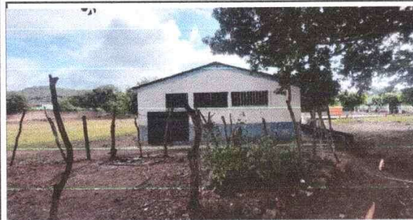
Foto 3: Parte del frente donde se realizará la ampliación de cocina