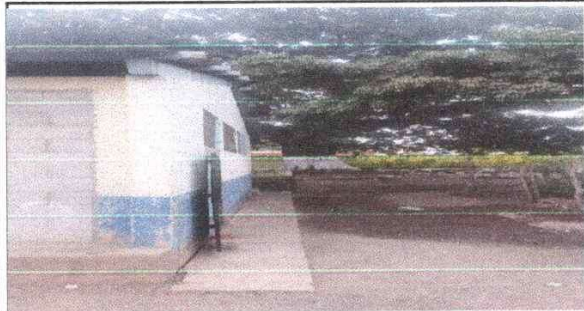
Foto 1: Parte del costado donde se realizará la ampliación de la cocina