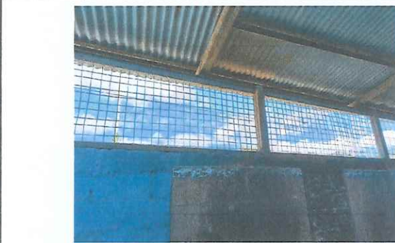
Foto 5: Muro que se levantará para mayor seguridad, porque no alcanza la altura del techo y la pared no tiene repello.