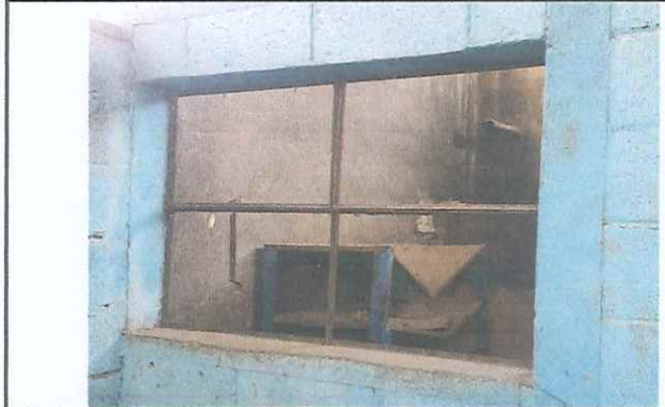
Foto 4: Ventana en mal estado se sustituirá para mayor seguridad de la bodega