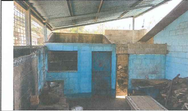
Foto 1: Bodega de cocina sin techo y sin repello, se cubrirá con terraza para mayor seguridad y se instalará un tinaco para garantizar el servicio de agua