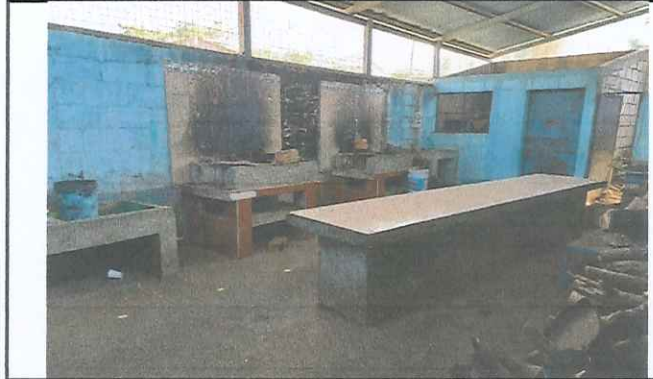
Foto 2: Área de cocina sin piso, muros no alcanzan el techo, sin repello en paredes