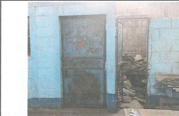
Foto 3: Puertas en mal estado, se unirán ambos espacios y se colocará una puerta más amplia