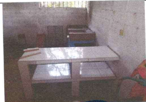
Foto 6: Cocina del establecimiento, se mejorara colocando una area de trabajo con azulejo, para mayor higiene en la preparacion de alimentos.

Observación: Si es necesario se pueden agregar hojas adicionales y actualizar el número de hojas.