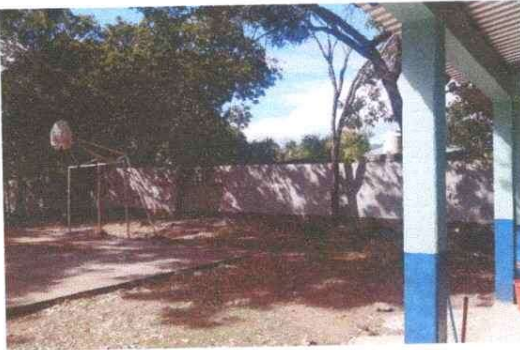
Foto 3: Mejoramiento muro de block para mayor seguridad del establecimiento.