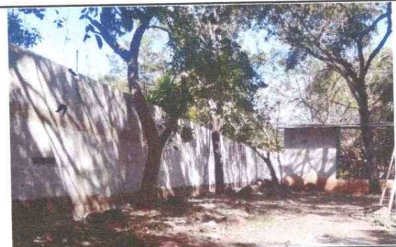
Foto 4: Mejoramiento muro de block para mayor seguridad del establecimiento.