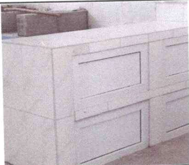
Foto 5: Cocina del establecimiento, se mejorara colocando una area de trabajo con azulejo, para mayor higiene en la preparacion de alimentos.