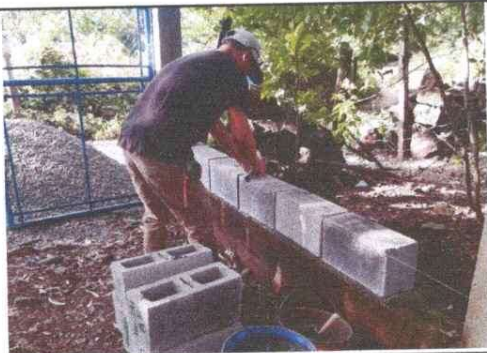
Foto 3: Mejoramiento muro de block para mayor seguridad del establecimiento.