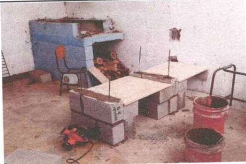
Foto 5: Cocina del establecimiento, se mejorara colocando una area de trabajo con azulejo, para mayor higiene en la preparacion de alimentos.