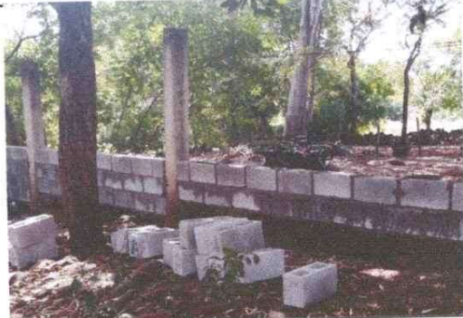
Foto 4: Mejoramiento muro de block para mayor seguridad del establecimiento.