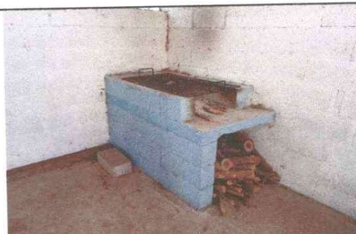
Foto 6: Cocina del establecimiento, se mejorara colocando una area de trabajo con azulejo, para mayor higiene en la preparacion de alimentos.

Observación: Si es necesario se pueden agregar hojas adicionales y actualizar el número de hojas.