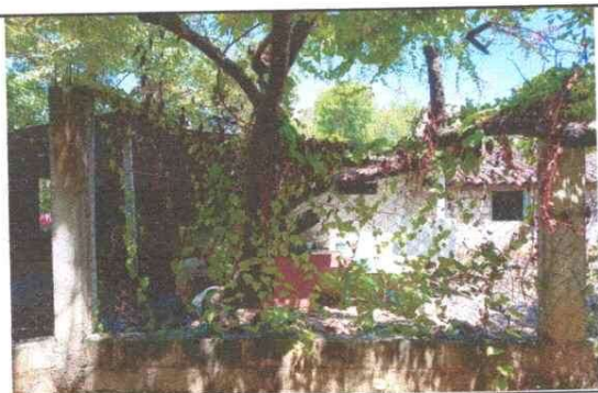
Foto 3: Malla en mal estado, se necesita sustituir por muro de block para mayor seguridad del establecimiento.