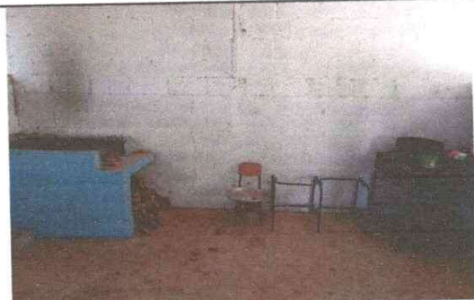
Foto 5: Cocina del establecimiento, se mejorara colocando una area de trabajo con azulejo, para mayor higiene en la preparacion de alimentos.