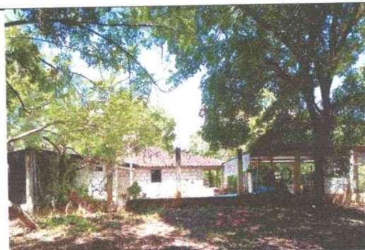
Foto 4: Malla en mal estado, se necesita sustituir por muro de block para mayor seguridad del establecimiento.