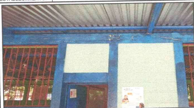
Foto 1: Sistema eléctrico del establecimiento deficiente, de cable sólido, expuesto, y conexiones provisionales.