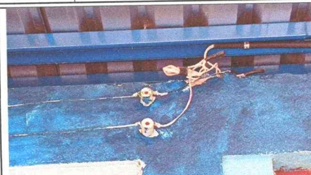
Foto 2: sistema eléctrico con cable paralelo, no recomendado para uso de un circuito eléctrico.