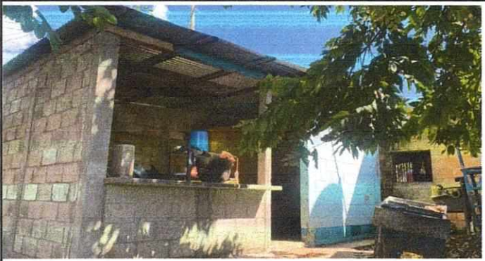
Foto 3: Remozamiento de cocina con levantado de paredes, techo y construcción de desayunador y banqueta.