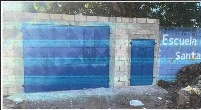
Foto 1: Levantado de paredes en el muro perimetral y remozamiento de portón y puerta de ingreso.