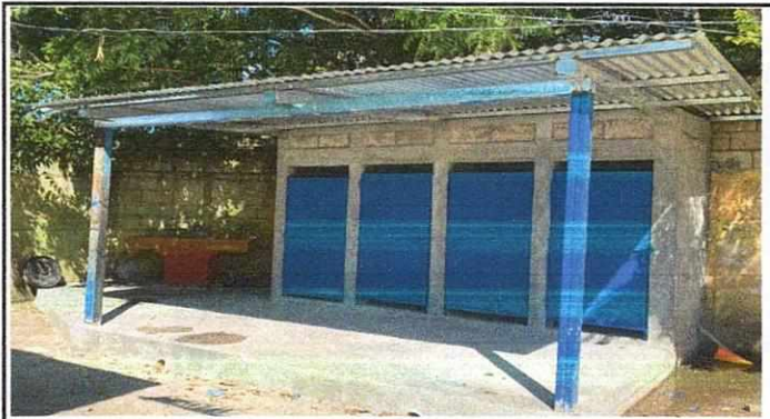
Foto 2: Mejoramiento de paredes, techo, puertas y construcción de banqueta en área de sanitarios.