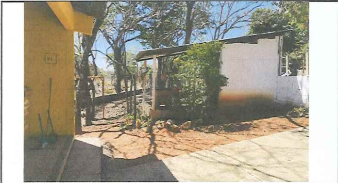
Foto 3: exterior de cocina sin pavimento lo que dificulta el ingreso en época de lluvia