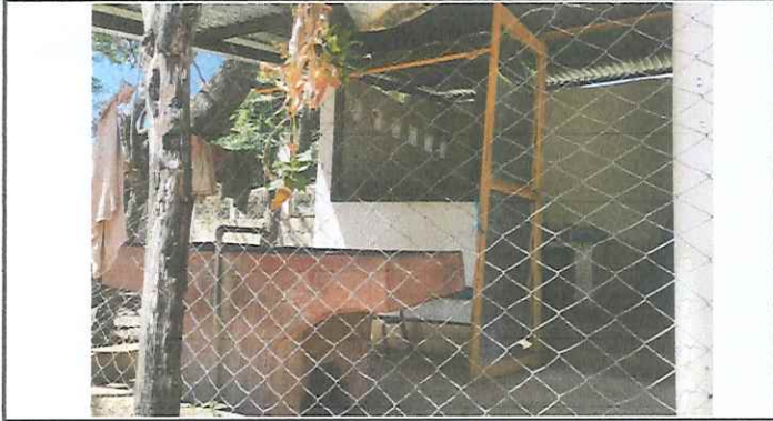
Foto 1: Puerta de cocina de madera y lamina se sustituirá por puerta de metal.