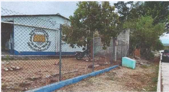
Foto 5 : Colocacion del Tubo galvanizado para la reparacion de la malla.