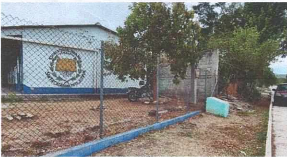
Foto 5 : Colocación del Tubo galvanizado para la reparación de la malla.