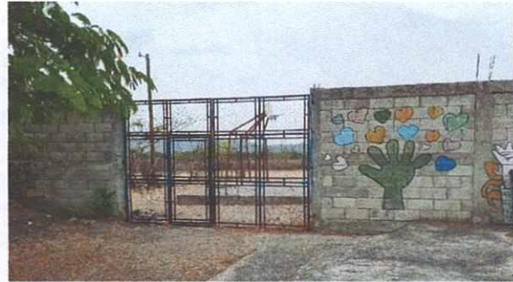
Reparación del portón posterior del establecimiento.