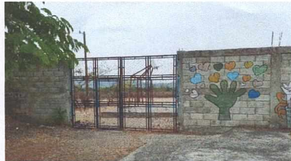
Foto 4: Ventana en mal estado se sustituirá para mayor seguridad de la bodega