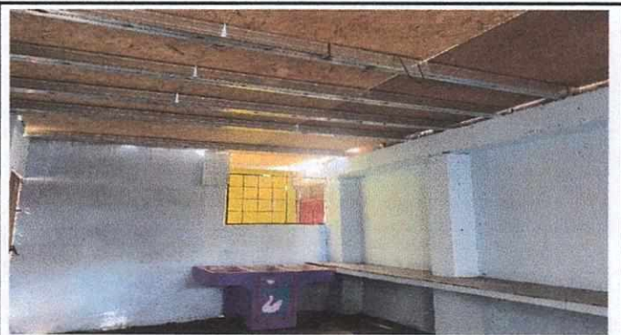
Foto 4: Pila de concreto restituida, para la hienización de alimentos preparados en el centro educativo