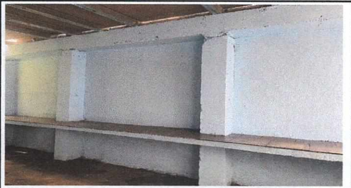
Foto 3: Molendero en acabado de cerámica para la preparación de alimentos