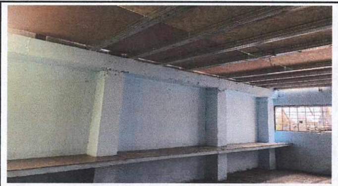
Foto 2: Pared lado oeste reforzada y molendero sustituido para la preparación de alimentos