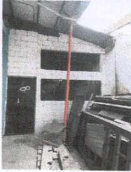
Foto 1: Remozamiento de cocina, para preparación de alimentos de la población estudiantil.