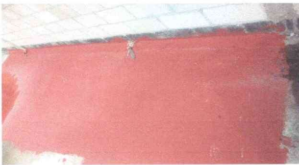
Finalizacion de la Aplicación del Impermiabilizante en la Parte de la Terraza del Establecimiento