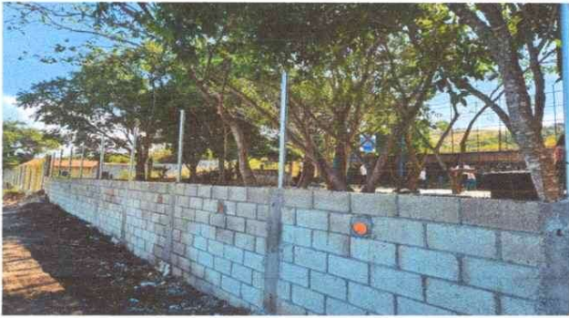
Colocacion de Salidas de Agua en Muro Perimetral del Establecimiento