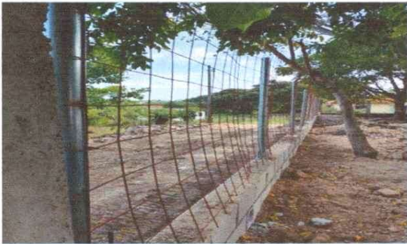
Levantado de Muro de Block y Colocación de Electromalla y tubo en muro Perimetral