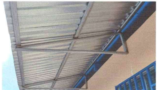
Colocación de Cubierta de Lamina con Estructura Metalica en el Segundo Nivel del Establecimiento