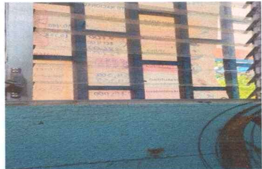
Sustitución de Paletas de Vidrio en las Ventanas de Alumno del Establecimiento

Observación: Si es necesario se pueden agregar hojas adicionales y actualizar el número de Hojas.