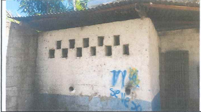
Foto 2: Techo de cocina con madera en mal esta, se sustituirá por estructura metalica y lamina calibre 26.