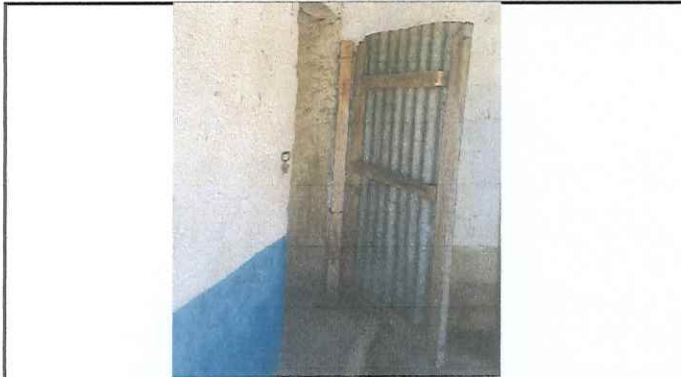
Foto 3: Puertas de cocina provincial de madera y lamina, se sustituirá con puertas de metal.