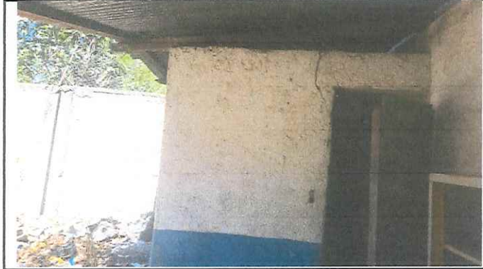
Foto 1: Paredes de cocina con grietas, se mejora y ampliará el area de cocina.