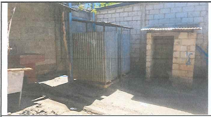
Foto 5: Baños con paredes de lamina, uno sin puertas, se mejorarán con paredes de block y puertas de metal.