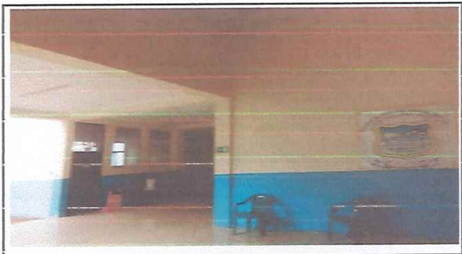
Sellador de humedades