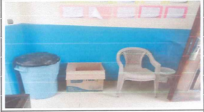
Fundición de concreto de 60x90x3.2