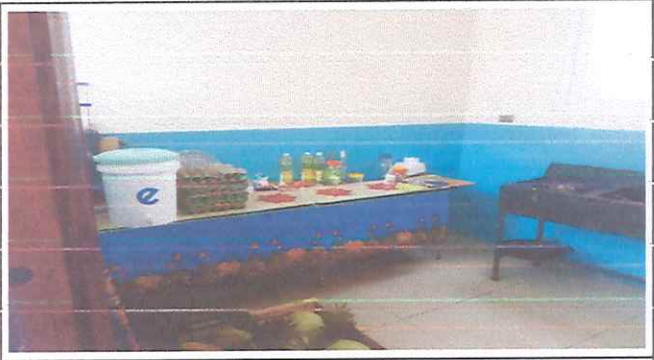
Fundición de concreto de 60x90x3.2