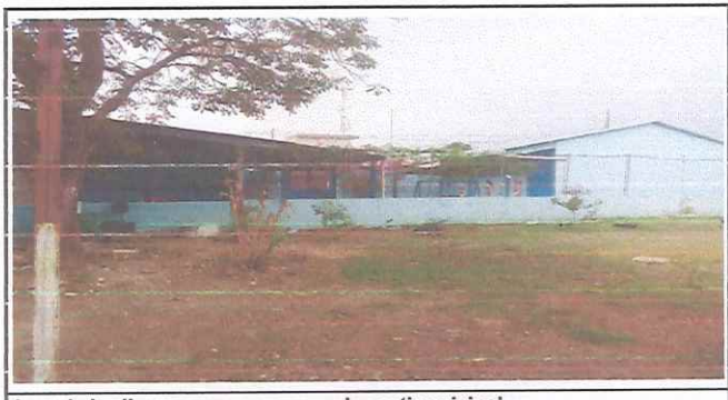
Area de jardin y mesas para comedor patio principal

Observación: Si es necesario se pueden agregar hojas adicionales y actualizar el número de hojas.