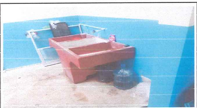
Pila fundida de 1.2x0.9x1.00