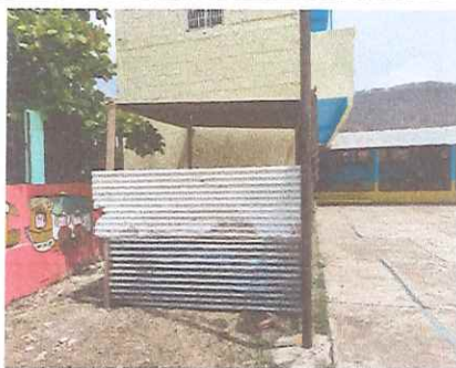
Foto 5: Exterior y parte trasera donde funciona la cocina del centro educativo.