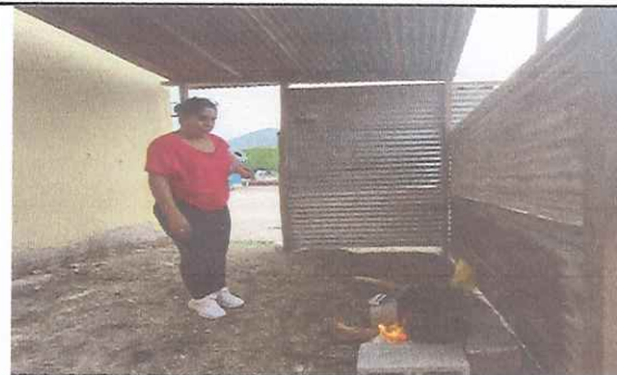
Foto 6: Profesora integrante de la Comisión de Alimentos verificando la cocción de algunos alimentos a leña.

Observación: Si es necesario se pueden agregar hojas adicionales y actualizar el número de hojas.