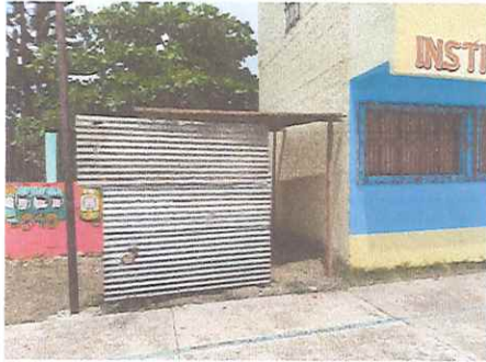
Foto 1: Lado frontal de galera en uso de cocina improvisada para la cocción de alimentos.