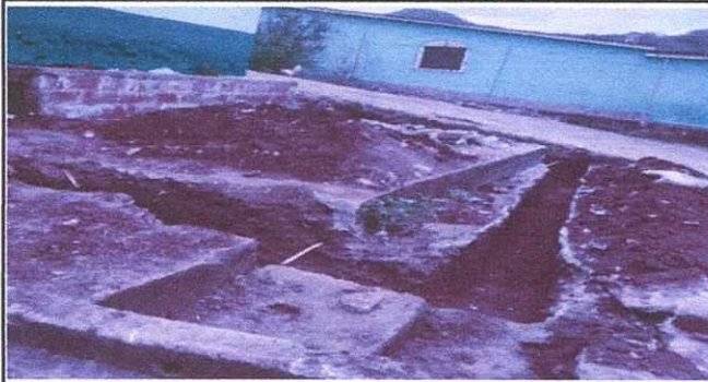
Foto1: cimientos para mejoramiento de la cocina